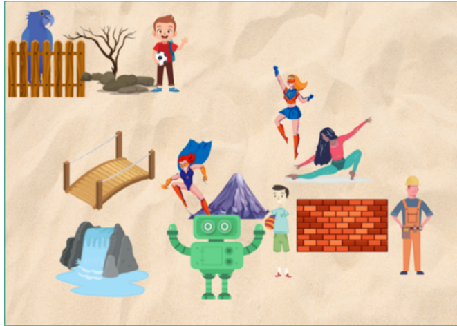
Figura 1. Átomo social.

A técnica do átomo social permitiu trabalhar as relações da paciente, apresentar dramaticamente as pessoas que são de fato emocionalmente significativas e entender as proximidades, distâncias, vínculos afetivos ou negativos existentes. Para isso, foi utilizada a ferramenta projetiva bandeja de areia on-line, da Oaklander Training (oaklandertraining.org), com bases na Gestalt terapia, adaptada para uso virtual em função da pandemia de COVID-19. Segundo Ramalho (2010, p. 111), o sandplay psicodramático é uma espécie de “imaginação ativa concreta” que possibilita ao cliente utilizar-se da sua espontaneidade-criatividade, por meio de uma realidade suplementar. A Fig. 1 mostra a imagem construída.